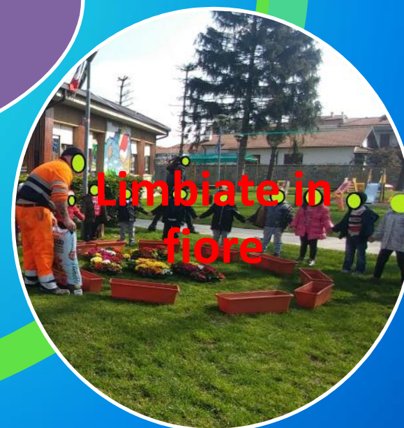
Limbiate in fiore