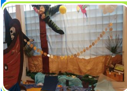
Isola del TATTO