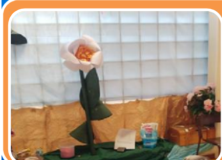
Isola del GUSTO e dell'OLFATTO