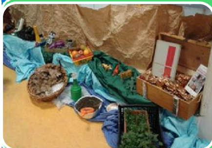
Isola della VISTA