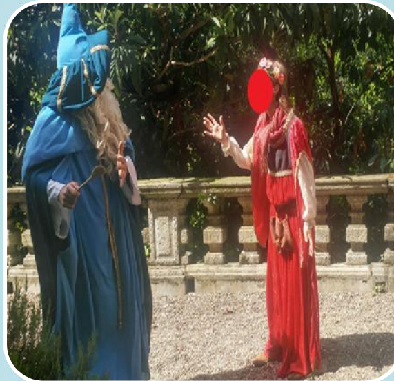
Castello di Somma Lombardo «Alla ricerca dei 5 tesori»