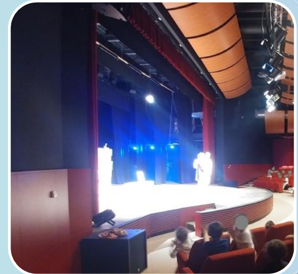
Teatro Comunale «A scuola non ci vado!»